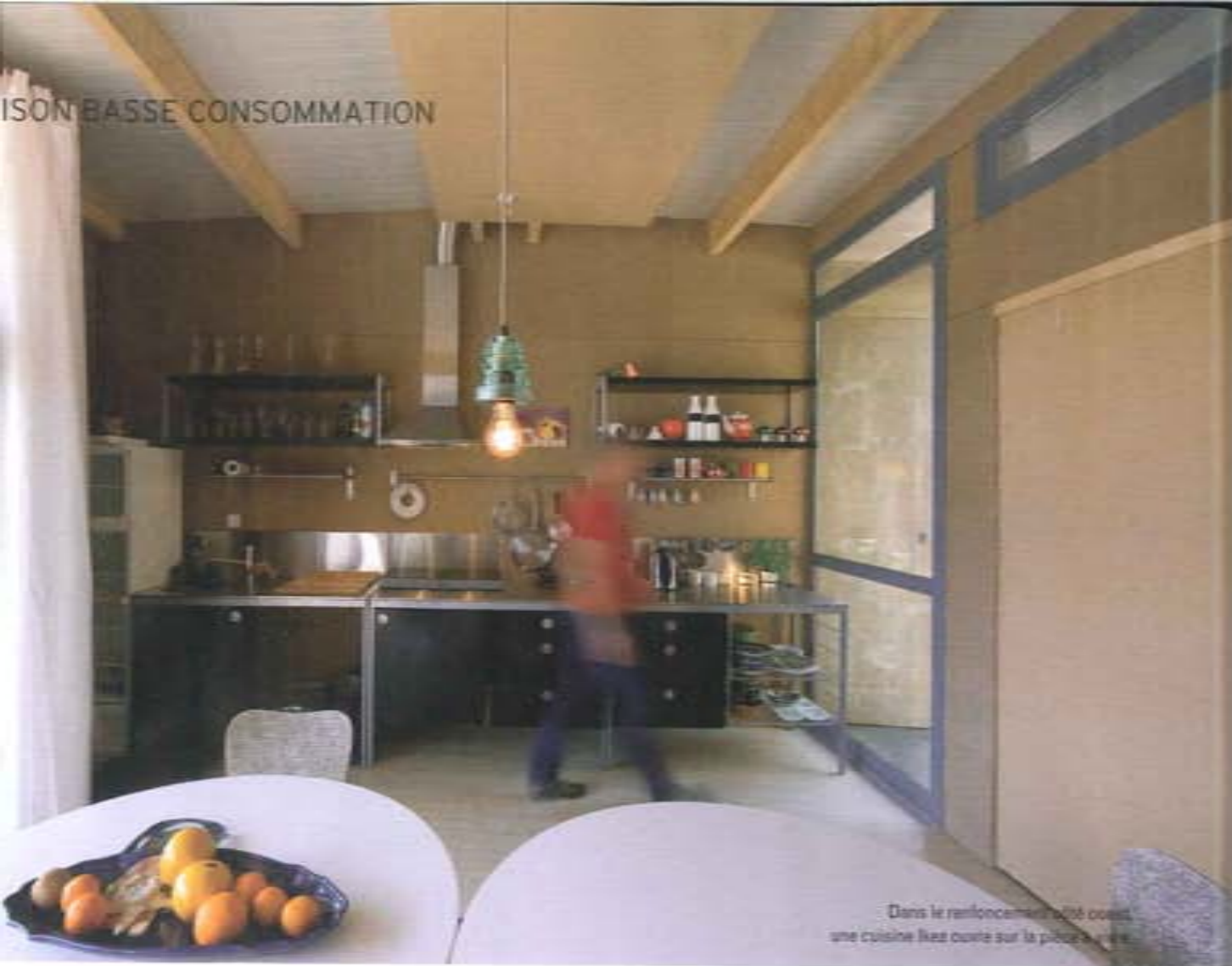
Dans le renforcement, il est possible d'insérer une cuisine fixe ou sur la place d'une

atmosphère chaleureuse de cabine de bateau caractérisent les cinq chambres, deux destinées aux adultes à l'ouest, trois aux enfants à l'est.