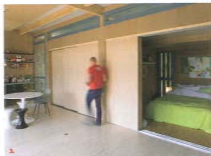
1. Installé dans la pièce principale, un poêle à bois Stiv suffit à chauffer la maison. 2 et 3. De grandes portes coulissantes permettent d'ouvrir les chambres sur le salon.

pu poser les poutres en lamellé-collé du plancher, les panneaux à caisson en épicéa préfabriqués (25 cm de largeur, garnis de 20 cm de laine de roche). Un pare-pluie puis le bardage en épicéa autoclave au nord et panneaux Virok au sud ont été posés sur l'ensemble des panneaux. À l'intérieur, les plaques de bois trois plis et médium seront laissées au naturel, pour une maison livrée au bout de six mois de chantier seulement "prête à décorer".